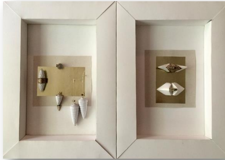
ภาพที่ 3 เครื่องประดับกระดาษ