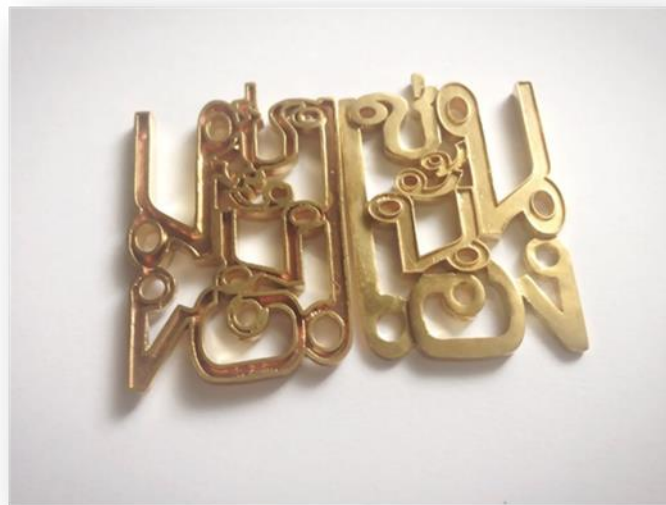
ภาพที่ 4 เข็มกลัดเซ่นนั่นเอง