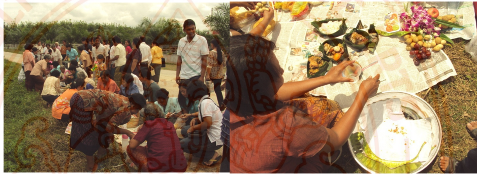
ภาพที่ 7 : ยกหมุ่รับ รับตายายเรียบร้อยแล้ว