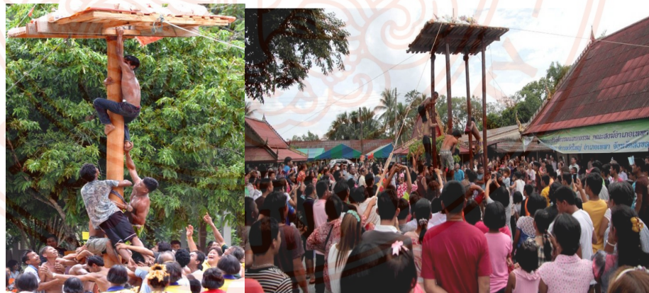
ภาพที่ 8 : ชิงเปรต