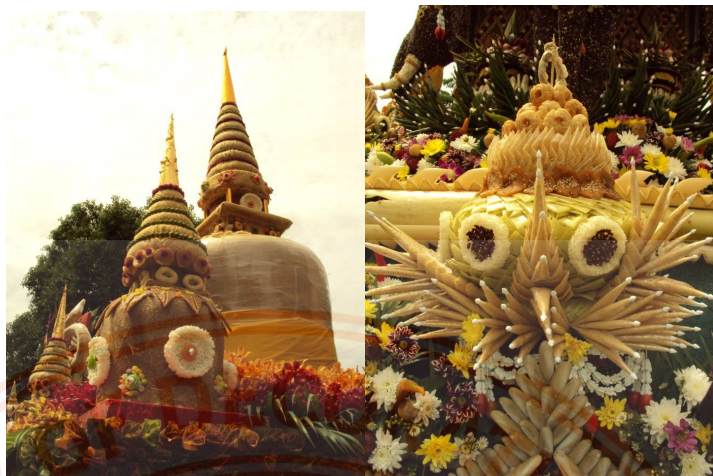
ภาพที่4: นอกจากนี้ก็มีการจัดขบวนห่มรับ เพื่อแห่แหนไปรอบๆตัวเมือง จ.นครศรีธรรมราช