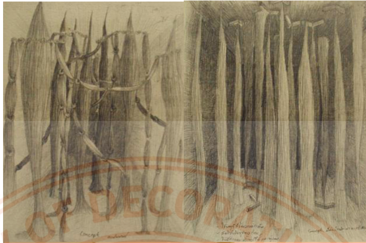
ภาพที่11: ภาพร่าง