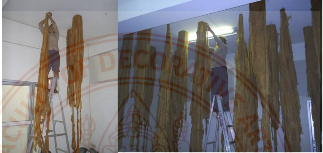
ภาพที่10 : ภาพขั้นตอนการสร้างสรรค์

ซึ่งมีลักษณะคล้ายกับผืนผ้าซึ่งส่วนสำคัญในการแสดงออกด้านพื้นที่ว่างใช้ห้องว่างเพื่อให้สอดคล้องกับเนื้อหาคือวันแรม15ค่ำจะต้องจัดสำหรับไว้ในห้องที่บ้านก่อนเดินทางไปวัดและสามารถสร้างความรู้สึกที่เชื่อมต่อจากเบื้องล่างสู่เบื้องบน เพื่อการสื่อสาร ระหว่างภพ ถือว่า พื้นที่ว่างมีความสำคัญและควบคู่ไปกับรูปทรง