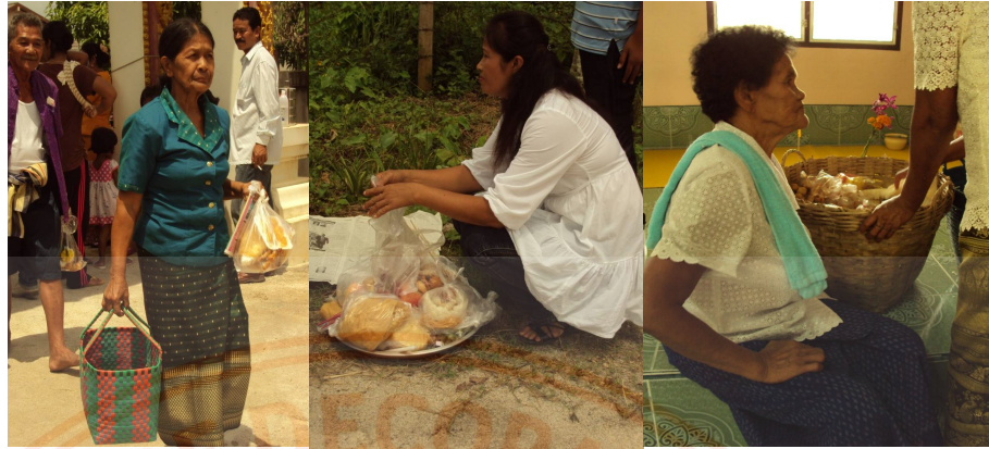
ภาพที่ 6 : พิธียกหมุ่รับ รับตายาย