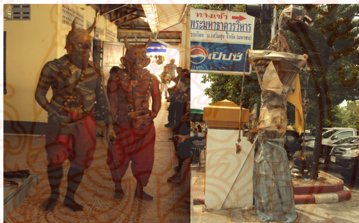
ภาพที่5 : คนที่แต่งตัวเป็นเปรต และหุ่นเปรตที่ยืนเฝ้าประตูวัด

* ตอนเด็กข้าพเจ้าไปวัดกับแม่แล้วเห็นคนที่แต่งตัวเป็นเปรตข้าพเจ้าเกิดความกลัวมากและเด็กๆ ในวัดต่างพากันวิ่งหนีเพราะความกลัว แม่ของข้าพเจ้าจึงสอนว่าต้องเป็นเด็กดี ประพฤติปฏิบัติ- ดี จะได้ไม่ตกนรกไปเป็นเปรตน่ากลัวอย่างที่เห็น