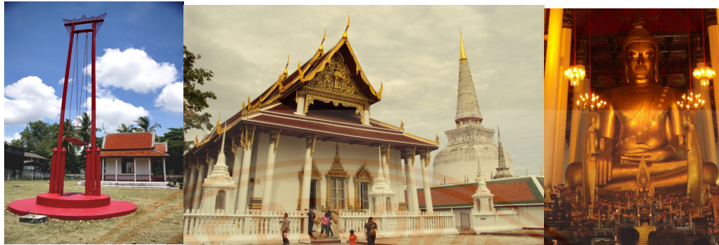
ภาพที่ 2 : หอพระอิศวร อ.เมือง จ.นครศรีธรรมราช โบราณวัตถุที่สำคัญของจังหวัดนครศรีธรรมราช บริเวณวัดพระมหาธาตุวรมหาวิหาร