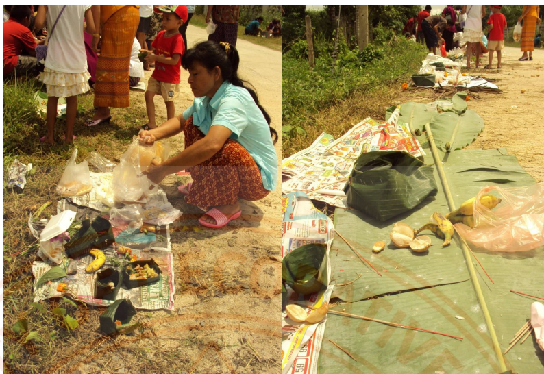
ภาพที่9 :จังหวัดทลลาไฟง.นครศรีธรรมราช นอกกำแพงวัดมีสตรีชาวอิสลามมารับขนม5ชนิดเพื่อเก็บไว้เป็นเสบียงไว้บริโภคซึ่งผลิตมาจากผลหมากรากไม้จากการเกษตรแทบทั้งสิ้นกล่าวคือ เป็นอาหารที่ได้มาจากพืชโดยผ่านกรรมวิธีการหมักเพื่อเป็นการถนอมอาหารเก็บเอาไว้ได้นานสามารถบริโภคได้ทุกศาสนาทั้งยังเป็น กุศโลบายสอนให้เอื้อเฟื้อเผื่อแผ่ต่อทุกคนทุกชนชั้น ทุกศาสนาในสังคมไม่ปิดกั้น เป็นการให้ที่เป็นทานอันยิ่งใหญ่

สรุป คติความเชื่อของภาคใต้ว่าด้วย ประเพณีบุญสารทเดือนสิบนั้นได้รับอิทธิพลมาจากศาสนาพราหมณ์และศาสนาพุทธตามลำดับ จากความอุดมสมบูรณ์ทางด้านภูมิศาสตร์ ก่อเกิดสังคมเกษตรกรรมซึ่งเกี่ยวข้องอยู่กับธรรมชาติจึงต้องเคารพธรรมชาติและเชื่อเรื่องไสยศาสตร์สิ่งเร้นลับ และผีเปรต(ผีตายาย) เพื่อช่วยแก้ปัญหาความเดือดร้อนทางใจในระดับหนึ่งที่สำคัญยังแฝงไว้ด้วยกุศโลบายอันดีงามที่อยู่ในรูปของนามธรรม คือมีทั้งความกตัญญู ,การเคารพผู้ใหญ่ ,การกลัวเกรงการทำบาป และการให้โดยไม่หวังผลตอบแทน ฯลฯ ล้วนแล้วแต่เป็นคำสอนที่ให้กลัวเกรงต่อบาปและมุ่งเน้นในการประพฤติปฏิบัติดีส่งผลต่อความรู้สึกนึกคิดส่วนตัวในการดำรงชีวิตของข้าพเจ้าและคนที่ประพฤติปฏิบัติประเพณีบุญสารทเดือนสิบนี้ทุกคน