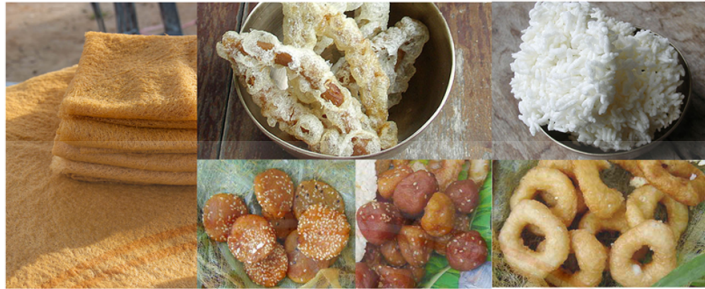
ภาพที่3: ขนมทั้ง5ชนิดเปรียบได้กับปัจจัย4“เพื่อให้ญาติที่เป็นเปรตได้ใช้ในปรโลก”และมีอาหารแห้งต่างๆ ข้าวสาร หอม กระเทียม เกลือ น้ำตาล ฯลฯ (ที่มา : http://www.bloggang.com/viewblog.php?id=samuian&date=13-10-2009&group=2&gblog=3 )

3. วันแรม15ค่ำเดือน10 คือ พิธิยก หมูรับ รับประทานอาหารคือก่อนออกจากบ้านนำหมูรับวางไว้ในห้องที่บ้าน (เพื่อเป็น สำหรับให้ ผีตายายที่กลับมาที่บ้าน) แล้วยกหมูรับอีกส่วนไปวัดใกล้บ้านนำอาหารไปวางไว้ตามต้นไม้หรือริมกำแพงวัดสำหรับผีไม่มีญาติและเมื่อสวดบังสุกุลอุทิศส่วนกุศลเสร็จเรียบร้อยแล้วชาวบ้านก็จะกรูกันเข้าไปแย่งอาหารเหล่านี้เพราะเชื่อว่าได้กุศลแรง เรียกพิธีนี้ว่า “พิธิชิงเปรต” เป็นการแสดงความสัมพันธ์ที่มนุษย์มีต่อสิ่งเหนือธรรมชาติ ส่วน หมูรับ เป็นการจัดสำหรับอาหารไปให้เปรตคือขนมทั้ง5ชนิดนั้นมุ่งเน้นที่จะใช้แปรเปลี่ยนเป็นกระแสดิจเพื่ออุทิศจิตวิญญาณทั้งหลายตามจุดมุ่งหมายของลูกหลาน ขนม5ชนิดเปรียบได้กับ ปัจจัย4ในการดำรงชีวิต พิธิชิงเปรตก็เปรียบเสมือนมาตรการทางสังคมให้มนุษย์ประพฤติปฏิบัติดี โดยผูกกับกรอบจริยธรรมอันดีจากความเชื่อเรื่องเปรตที่ต้องทุกข์ทรมานด้วยการกระทำของตนเอง เมื่อครั้งยังมีชีวิตอยู่หรืออดีตภพ ในแง่ของความรู้สึกพิธิชิง - เปรตทำให้เกิดความสุขกายสบายใจที่ได้แสดงความกตัญญูต่อ บรรพบุรุษที่มีพระคุณ