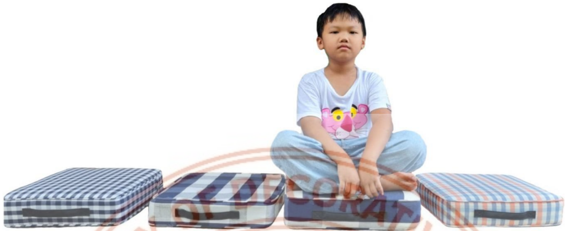
ภาพที่ 12 เซ็ตเบาะรองนั่ง จะเห็นลวดลายและสีสันทันของผืนผ้าขาวม้าแบบดั้งเดิม มีทั้งตาใหญ่ และตาเล็ก

6) เซ็ตเบาะรองนั่ง : เบาะรองนั่งทรงสี่เหลี่ยมจากผืนผ้าขาวม้า เป็นการนำผืนผ้าขาวม้าสำเร็จจากโรงงานกิมกีการทอ มานำเสนอในรูปแบบของผลิตภัณฑ์ใหม่ เบาะสามารถหิ้วไปมาได้ง่ายด้วยหูหิ้วคล้ายกระเป๋า