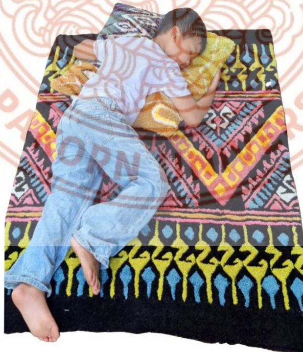
ภาพที่ 9 พรมรองนั่ง จากลายผ้าจก

4) พรมรองนั่งจากลายผ้าจก : พรมปักไหมพรม ขนาด 1x1.5 เมตร จากลวดลายขึ้นต้นจก “โค้งแก้งค์ฮ้อนเซีย” จับคู่สีในเฉดใหม่ให้สดใสและโดดเด่น แต่ยังคงพื้นดำ แซมชมพู ตามด้วยขาว เหลือง เขียว เพิ่มสีฟ้าสดเข้ามาใช้ร่วมคู่สีชมพู ทำให้ผลงานมีความเด่นมากยิ่งขึ้น