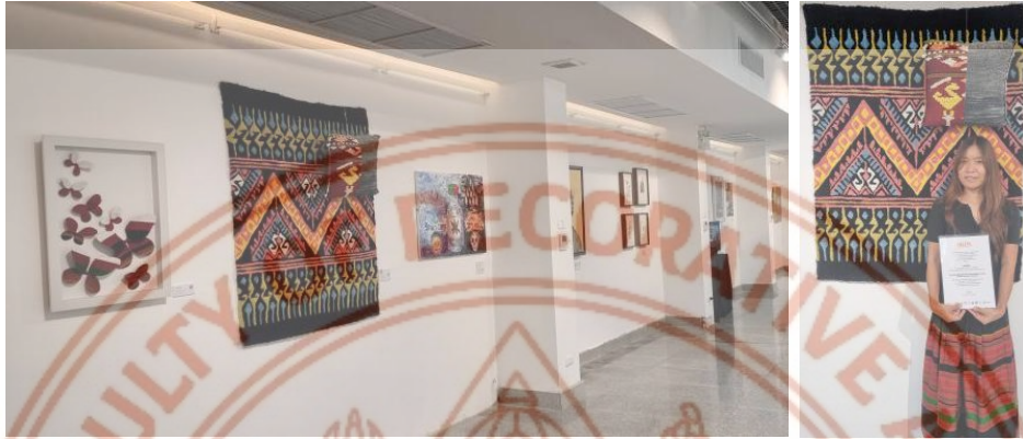
ภาพที่ 10 บรรยากาศในการแสดงนิทรรศการ

ผลงานชิ้นนี้ได้ร่วมจัดแสดงใน “นิทรรศการผลงานสร้างสรรค์ประจำปี 2565” : Silpa Creative Works Exhibition 2022 เป็นนิทรรศการระดับชาติซึ่งจัดขึ้นเป็นครั้งแรกของคณะมัณฑนศิลป์ ที่นำเสนอและเผยแพร่ผลงานสร้างสรรค์ทางศิลปะและการออกแบบ เกิดจากความร่วมมือสนับสนุนและส่งเสริมจากหลายภาคส่วนและมหาวิทยาลัยชั้นนำทั่วประเทศ โดยเวทีเผยแพร่ผลงานนี้ ได้รับเกียรติจากผู้ทรงคุณวุฒิทางด้านวิชาการและวิชาชีพที่มีประสบการณ์สูงจากหลายสถาบัน ให้ความกรุณาเป็นผู้พิจารณาประเมินผลงาน (Peer Review) เพื่อคัดเลือกผลงานในการจัดแสดงในนิทรรศการอย่างถูกต้องเหมาะสม โดยผลงานชิ้นนี้จัดแสดงในชื่อ “พรมวิเศษ”