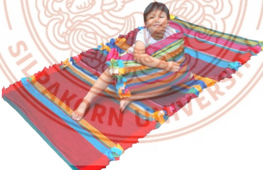
ภาพที่ 7 พรมรองนั่ง พรมปักนิต

2) พรมรองนั่ง พรมปักนิต : ผืนผ้าขนาด 1x2.5 เมตร และหมอนขนาด 50x50 เซนติเมตร 1 ใบ ทอด้วยเส้นผ้าตัดริ้ว นำลักษณะของ “ซิ่นแล่” หรือบางที่เรียกว่า “ซิ่นเลื่อน” ที่มีพื้นสีดำทอแดงสลับคราม มาเป็นแรงบันดาลใจ ชิ้นงานสร้างสรรค์ ใช้สัดส่วนของสีโทนร้อน-เย็นที่ร้อยละ 70-30 มีประโยชน์ใช้สอยเป็นพรมปูรองพื้นสำหรับนั่ง หรือนอน เย็บรองด้วยใยสังเคราะห์ฟูหนา 1 นิ้ว ทำให้ชิ้นงานมีความนุ่ม ประกอบด้วยหมอนสำหรับหนุนอีก 1 ใบ