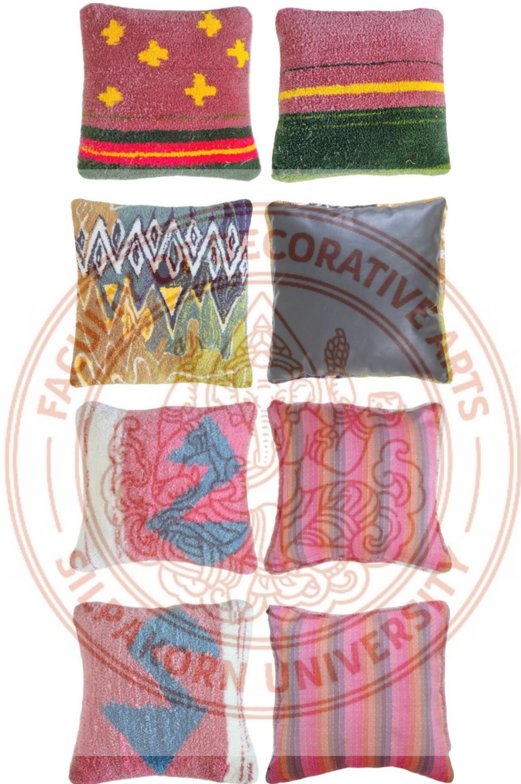
ภาพที่ 11 หมอนอิงลวดลายต่าง ๆ