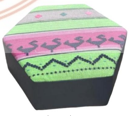
ภาพที่ 5 ลายชิ้นดาหมู่จกลาย