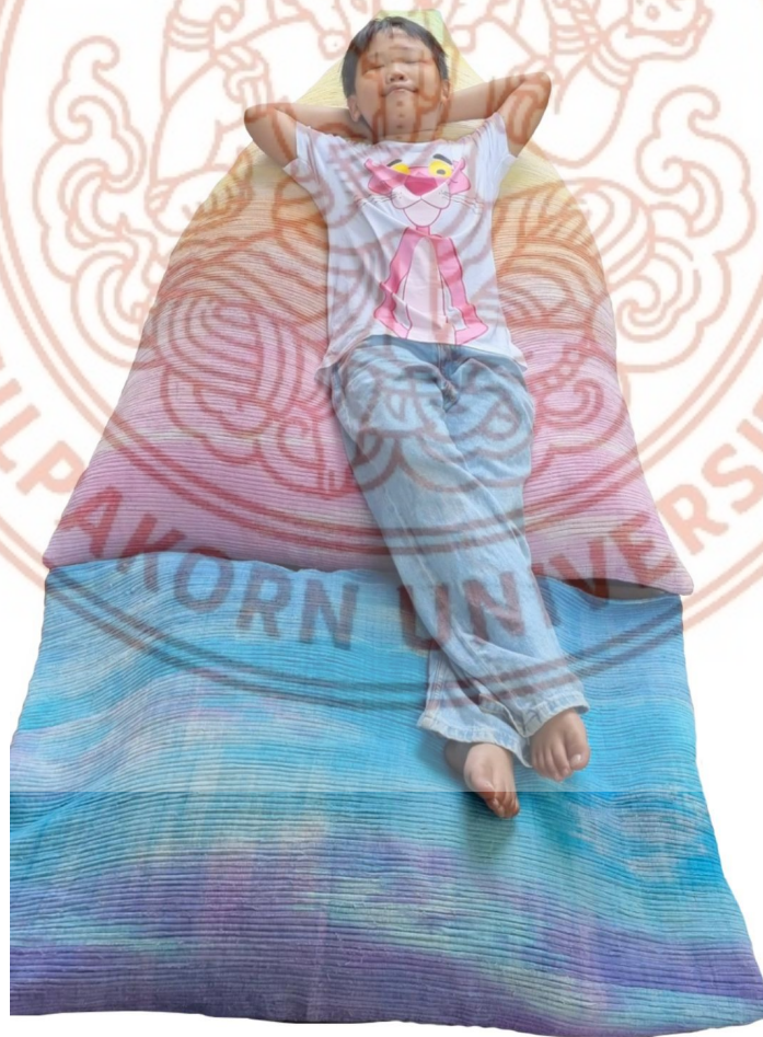
ภาพที่ 13 ชุดปิ่นปัก

7) ชุดปิ่นปัก : ผ้าทอจากเส้นฝ้ายอมสี ตัดเย็บเป็นชุดปิ่นปักและเบาะรองเท้า