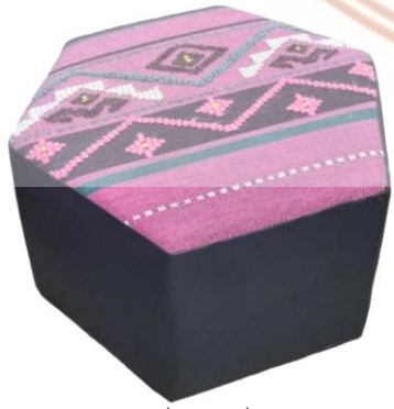
ภาพที่ 3 ลายชิ้นจก