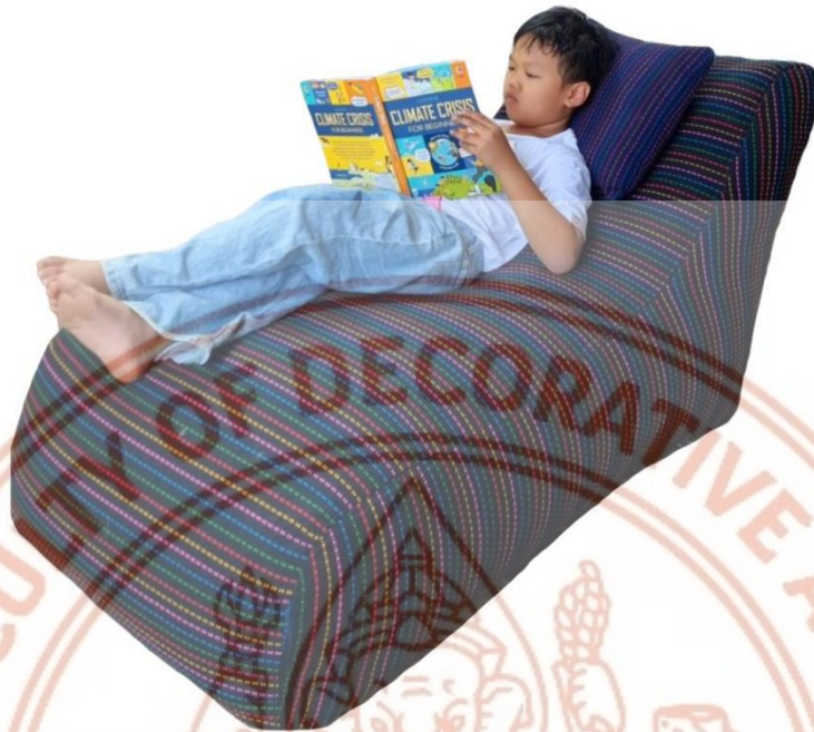
ภาพที่ 8 ปิ่นแบ็ก

3) ปิ่นแบ็ก และหมอนอิง : ผืนผ้าพื้นสีดำทอสลัเส้นสีด้วยเทคนิคยกขิด ทอด้วย 5 สีหลักสลับกันไปตลอดทั้งผืน นำมาตัดเย็บเป็นเบาะรองนั่งปิ่นแบ็กบรรจุไส้ใยด้วยเม็ดโฟม ใช้สำหรับนั่งฟัง พักผ่อนหย่อนใจ และหมอนหนุน 2 ใบเล็ก ใช้สำหรับหนุนอิง