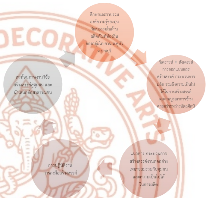
ภาพที่ 1 กรอบแนวคิดการวิจัย/สร้างสรรค์

6. สะท้อนภาพผลงานสร้างสรรค์ งานวิจัยสู่ชุมชน เป็นการเผยแพร่องค์ความรู้และต่อยอดมหายใจของวัฒนธรรม