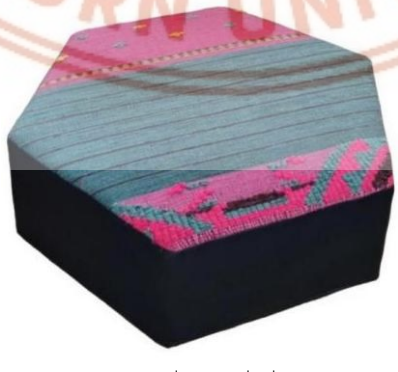
ภาพที่ 4 ลายชิ้นชีว