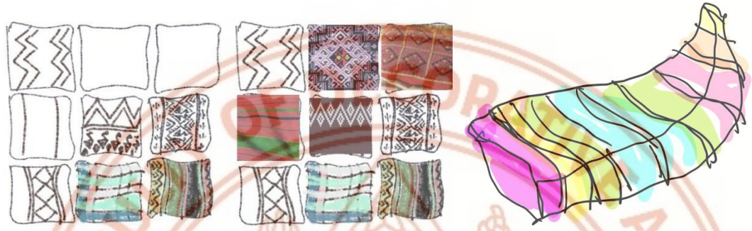
ภาพที่ 2 ภาพร่างลายเส้นแนวทางของผลิตภัณฑ์สร้างสรรค์ จัตุวางองค์ประกอบ สีส้น และลวดลายจก

ผลการดำเนินงาน ได้เป็นผลิตภัณฑ์ที่มีความร่วมสมัยในบริบทปัจจุบัน มีรูปแบบการใช้สอยที่ตอบสนองต่อผู้บริโภคกลุ่มใหม่ที่มากกว่าการเป็นผืนผ้าชิ้นเพื่อการสวมใส่ ได้เป็นผลงานสร้างสรรค์ที่เกิดจากการทอและการสร้างสรรค์งานศิลปะสิ่งทอแบบประยุกต์จากประสบการณ์ของผู้วิจัย เป็นการใช้เทคนิคการทอจกที่ปรับเปลี่ยนเส้นใยในการทอให้มีความแตกต่าง โดยใช้เส้นผ้ามาทอรวมเป็นเส้นพุ่ง และเส้นพุ่งปกติ เกิดเป็นลวดลายและสีส้นใหม่จากการตัดทอนรูปทรงจากลวดลายบนผืนผ้าจกแม่ลายมาแล้ว ด้วยขนาดของเส้นพุ่งจกที่เปลี่ยนไป ทำให้ภาพลักษณ์ของลวดลายจกในผลงานที่นำเสนอออกมาชัดเจนและโดดเด่นมากยิ่งขึ้น อีกทั้งเทคนิคการย้อมให้เป็นลวดลายจากผืนผ้าจก ประหนึ่งเป็นการเปลี่ยนบริบททุกสิ่งของผืนผ้าทอไปสิ้นเชิง ทั้งรูปแบบของชิ้นงาน การใช้ประโยชน์จากผืนผ้า ขนาดของลวดลาย และสีส้นของงาน เปลี่ยนการรับรู้และสร้างการยอมรับด้วยภาพลักษณ์ใหม่ ด้วยชุดผลงานสร้างสรรค์ ดังนี้