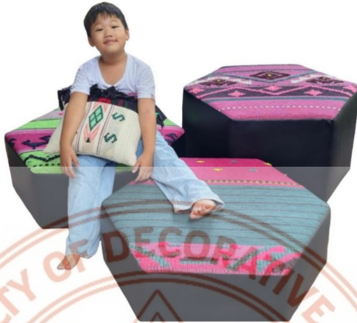
ภาพที่ 6 เบาะรองนั่งทรง 6 เหลี่ยม

2) พรมรองนั่ง พรมปักนิต : ผืนผ้าขนาด 1x2.5 เมตร และหมอนขนาด 50x50 เซนติเมตร 1 ใบ ทอด้วยเส้นผ้าตัดริ้ว นำลักษณะของ “ซิ่นแล่” หรือบางที่เรียกว่า “ซิ่นเลื่อน” ที่มีพื้นสีดำทอแดงสลับคราม มาเป็นแรงบันดาลใจ ชิ้นงานสร้างสรรค์ ใช้สัดส่วนของสีโทนร้อน-เย็นที่ร้อยละ 70-30 มีประโยชน์ใช้สอยเป็นพรมปูรองพื้นสำหรับนั่ง หรือนอน เย็บรองด้วยใยสังเคราะห์ฟูหนา 1 นิ้ว ทำให้ชิ้นงานมีความนุ่ม ประกอบด้วยหมอนสำหรับหนุนอีก 1 ใบ