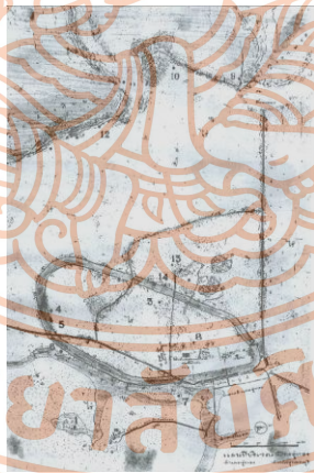
ภาพที่ 2 แผนที่จากการสำรวจโบราณสถาน ของกรมศิลปากร