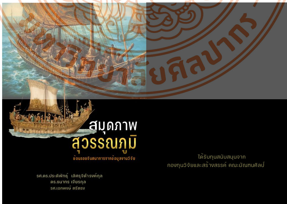
ภาพที่ 4 หน้า ตัวอย่าง ปกหน้าปกหลัง วางแนวคิด การติดต่อค้าขายของชาวต่างชาติมาสุวรรณภูมิ