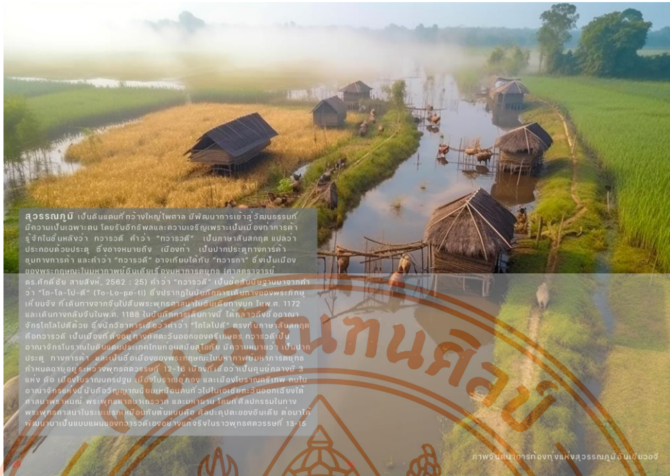
สุวรรณภูมิ เป็นดินแดนที่กว้างใหญ่ไพศาล มีพัฒนาการเข้าสู่วัฒนธรรมที่มีความเป็นเฉพาะตน โดยรับอิทธิพลและความเจริญเพราะเป็นเมืองท่าการค้าที่สำคัญในอันหนึ่งชื่อว่า กวารวดี คำว่า "กวารวดี" เป็นภาษาสันสกฤต แปลว่า ประกอบด้วยประเทศ ซึ่งอาจหมายถึง เมืองท่า เป็นปากประตูทางการค้าขนทางการค้า และคำว่า "กวารวดี" อาจเกี่ยวได้กับ "กวารภ" ซึ่งเมืองเมืองของพระฤๅษณ์ในมหากาพย์อันเลื่องชื่อมหากาพย์ยถุ (เวทสตราจารย์ คร.ศ.ค.ศ. ๕๖๕ : ๕๖๖) คำว่า "กวารวดี" เป็นชื่อสมัยโบราณมาจากคำว่า "โตะ-โล-โป-ตี" (To-Lo-po-ti) ซึ่งปรากฏในบันทึกการเดินทางของพระภิกษุเหียนจิ่ง ที่เดินทางจารวัตรไปสืบพระพุทธศาสนาในอินเดียทางบก ในพ.ศ. 1172 และเดินทางกลับถึงในพ.ศ. 1188 ในบันทึกการเดินทางนี้ ได้กล่าวถึงชื่ออาณาจักรโตะโลโปตีด้วย ซึ่งนักวิชาการเดิมนำคำว่า "โตะโลโปตี" ตรงกับภาษาสันสกฤตคือกวารวดี เป็นเมืองที่ตั้งอยู่ทางทิศตะวันออกเฉียงใต้ของนคร กวารวดีเป็นอาณาจักรโบราณในดินแดนประเทศไทยตอนบนยุคก่อน มีความหมายว่า เป็นปากประตู ทางการค้า และเป็นชื่อเมืองของพระฤๅษณ์ในมหากาพย์ยถุที่กล่าวถึงก่อนจะกล่าวถึงสุวรรณภูมิ (พ.ศ. ๒๕๖๖) เป็นชื่อเมืองในมหากาพย์ยถุแห่งหนึ่ง ซึ่งหมายถึงดินแดนสมัยก่อนประวัติศาสตร์ และเมืองโบราณที่พบซากอารยธรรมสมัยก่อนประวัติศาสตร์ในบริเวณนี้ ซึ่งมีความสัมพันธ์กับอารยธรรมอินเดีย พหุวัฒนธรรมทางประวัติศาสตร์ และวัฒนธรรมของดินแดนแถบนี้ คือศิลปกรรมของอินเดีย ล้วนนำเข้ามาเป็นแบบแผนของกวารวดีเองอย่างแท้จริงในราวพุทธศตวรรษที่ 13-15